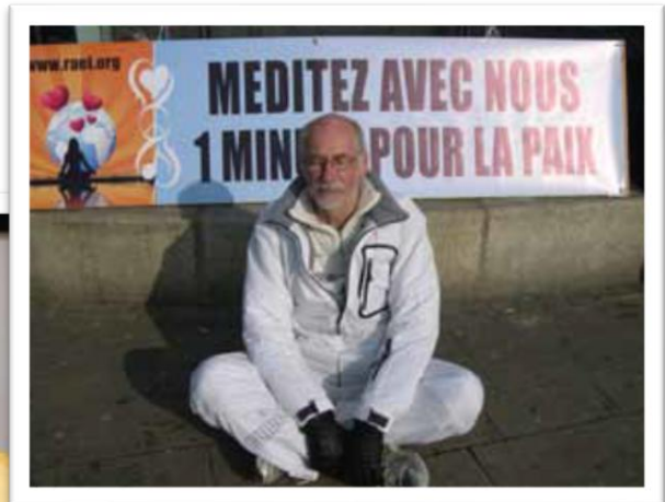
Meditación por la paz en Angers, Francia