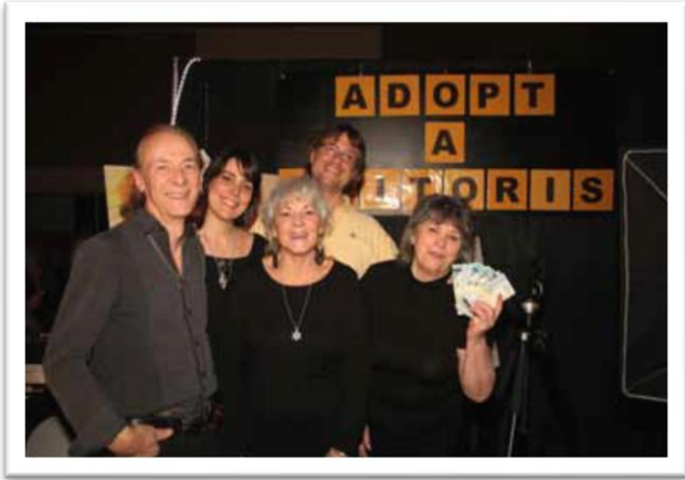
Recaudación de fondos para Clitoraid en Ottawa y Montreal