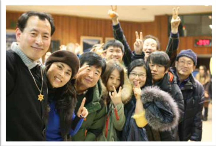
El equipo coreano tuvo su reunión nacional en enero. Meditación y risas... ¡y el placer de estar juntos!