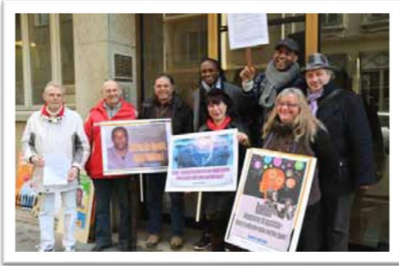
El Equipo de Lyon