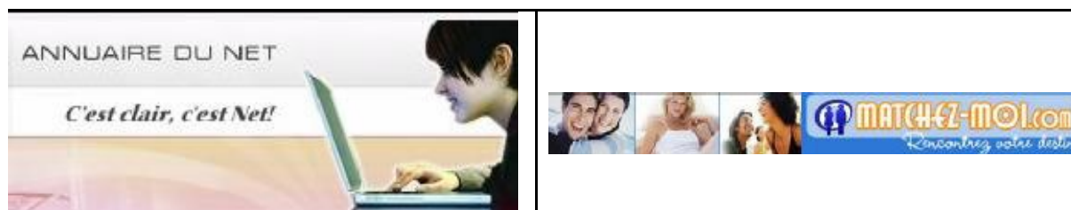
Figura 4. Ecco una comparazione di pubblicità che propongono il medesimo tipo di servizio: incontri via Internet. A sinistra, un sito per adolescenti («È chiaro, è Net!»). Nessuna allusione al futuro, alla sicurezza o alla serietà. A destra, una pubblicità molto più invitante: «incontrate il vostro destino». Questa pubblicità destinata ad un pubblico adulto si vuole, malgrado tutto, giovane. Ci si vedono dei giovani adulti con uno slogan che più serio non si può.

Le figure 4 e 5 comparano delle pubblicità che riguardano servizi o prodotti simili, ma una è destinata ai giovani e l'altra agli adulti. La differenza è evidente.