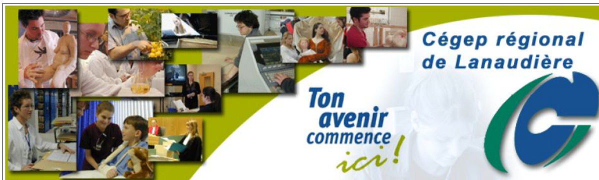
Figura 2. Illustrazione sulla pagina d'ingresso di un sito Internet per un corso di formazione professionale.

Sembra che il mondo dell'educazione abbia compreso nettamente meno bene la realtà degli adolescenti di quanto vi sia riuscito il mondo del consumo: nell'educazione, si costruisce tutto sulla motivazione, ossia sul domani, sull'avvenire. S'impegnano i giovani in programmi in cui il piacere è nel futuro. Si parla loro senza sosta del loro avvenire e dell'importanza di fare lunghi studi per riuscire nella loro vita. La figura 2 è un'illustrazione eloquente di questa visione imperniata sull'altrove e sul domani.