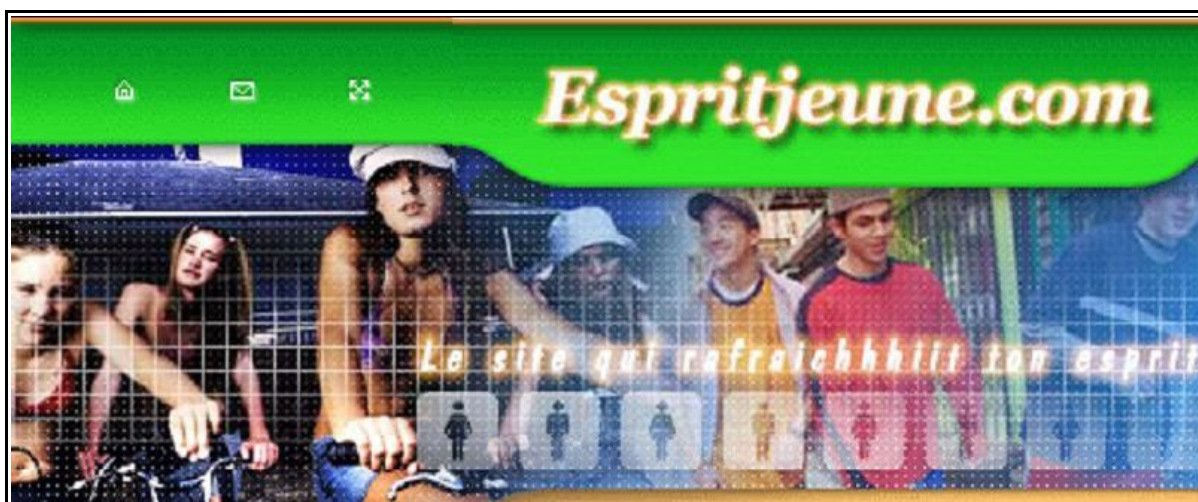
Figura 3. Illustrazione sulla pagina d'ingresso di un sito di giovani. Lo slogan non fa alcun riferimento all'avvenire. Mostra alcuni giovani che si divertono ed il loro slogan «Il sito che ti riinfresca lo spirito» è anch'esso presente.

Invece, tutta la pubblicità ed il marketing destinati ai giovani sono essenzialmente costruiti sul piacere immediato. Le pubblicità che hanno come bersaglio i giovani non parlano di domani o di futuro. Presentano loro tutto secondo una prospettiva molto presente, ben imperniata sul piacere immediato. È quanto illustra la pagina d'ingresso di un sito per giovani della figura 3.