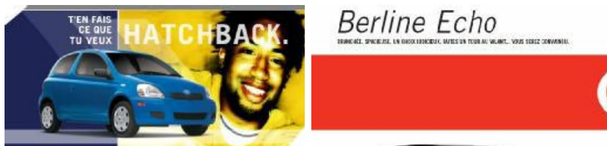
Figura 5. Qui si vede un esempio della stessa automobile, a sinistra il modello Hatchback, destinato ai giovani, ed a destra il modello Berlina, che si rivolge ad un consumatore più maturo. Gli slogan sono molto eloquenti: il modello giovane dice « Ne fai ciò che vuoi », mentre lo slogan adulto dice « Alla moda. spaziosa. Una scelta giudiziosa. Fate un giro al volante. Ve ne convincerete ». Lo stile adulto è molto più conservatore e razionale.

Figura 4. Ecco una comparazione di pubblicità che propongono il medesimo tipo di servizio: incontri via Internet. A sinistra, un sito per adolescenti («È chiaro, è Net!»). Nessuna allusione al futuro, alla sicurezza o alla serietà. A destra, una pubblicità molto più invitante: «incontrate il vostro destino». Questa pubblicità destinata ad un pubblico adulto si vuole, malgrado tutto, giovane. Ci si vedono dei giovani adulti con uno slogan che più serio non si può.