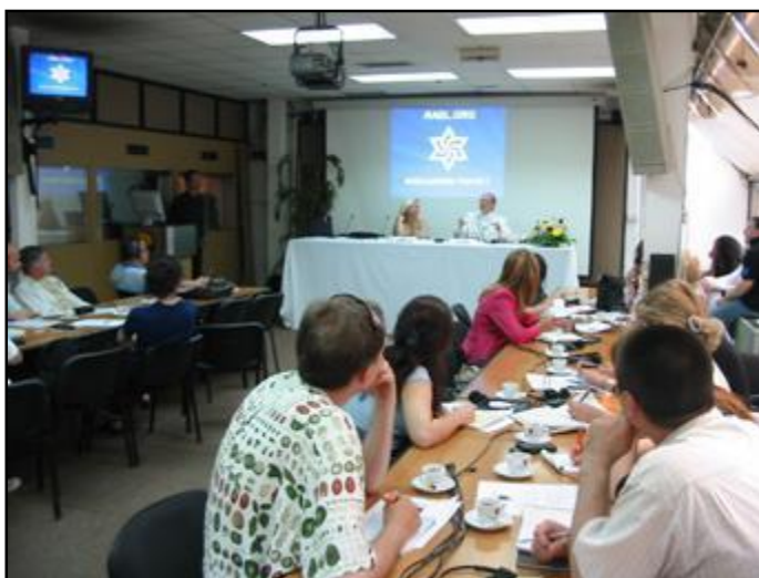
Conferenza stampa a Belgrado, Serbia

Il Nostro Amato Profeta ha proseguito la tournée Europea prima in Serbia e poi Svizzera per i seminari d'Europa.