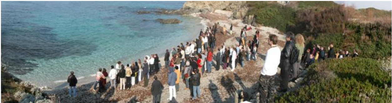
Momenti di contemplazione in riva al mare

Un programma veramente ricco d'insegnamenti ci ha incantato: le numerose persone intervenute ci hanno aiutato a crescere parlando di femminilità, di giovinezza, di storia del sesso, di scienza che giustifica l'ateismo.