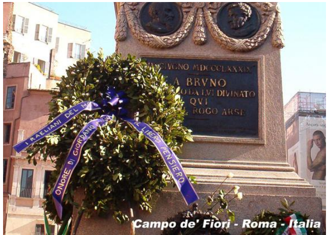
Campo de' Fiori - Roma - Italia