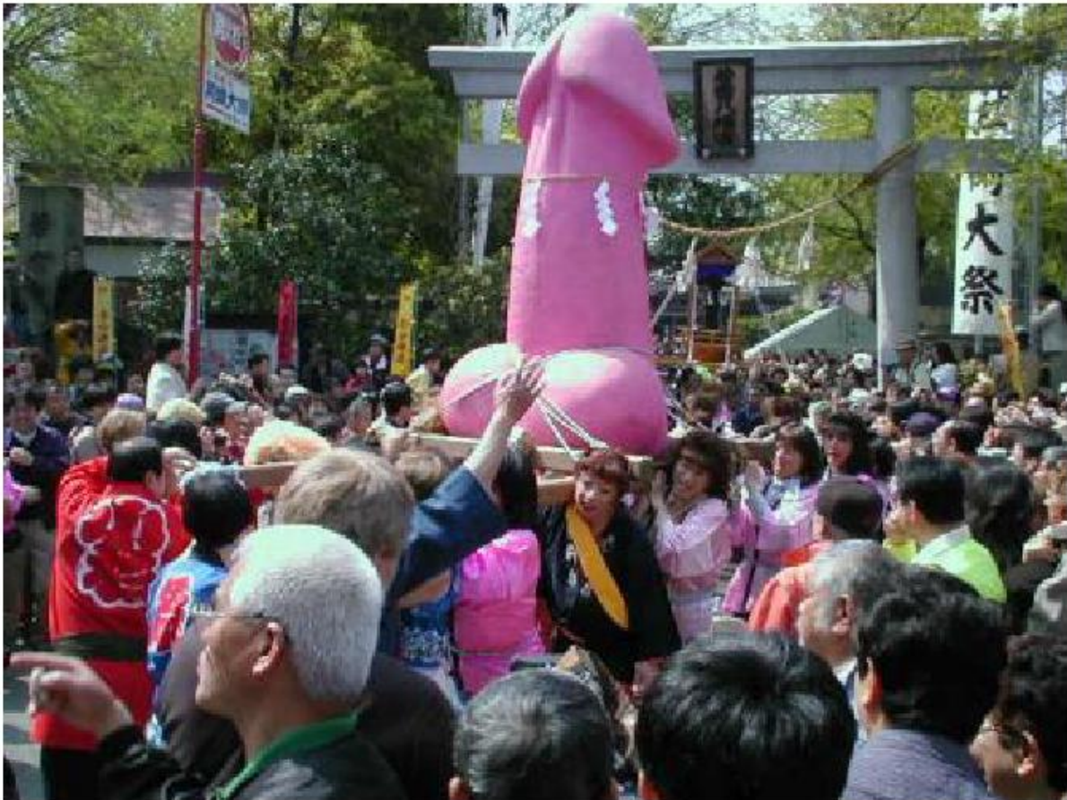
Un festival tradizionale in Giappone J