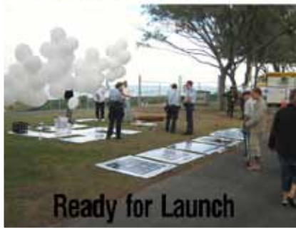
Ready for Launch