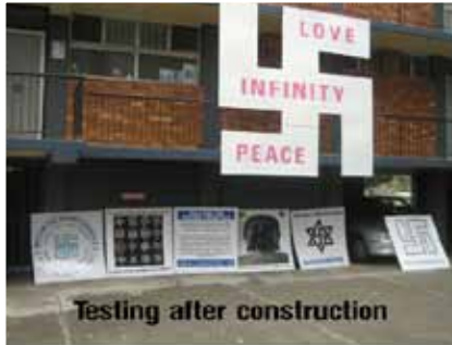
Testing after construction

Nous voulons toujours faire cette action, peut-être dimanche prochain à Brisbane.